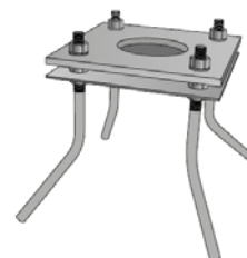
Esempio di piastra con tirafondi